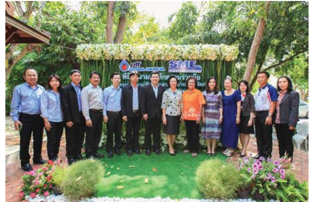
“ชุมชนหนองแพบ” ต.มาบตาพุด อ.เมือง จ.ระยอง